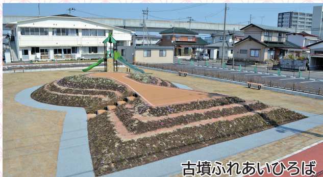
古墳ふれあいひろば