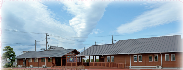
「考古の展示室」と「歴史・民俗の展示室」